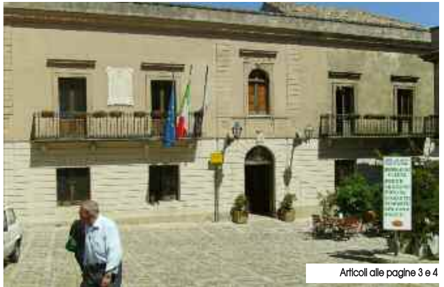
Articoli alle pagine 3 e 4