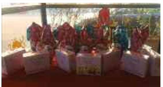
Associazione A.SVI.TUR. onlus