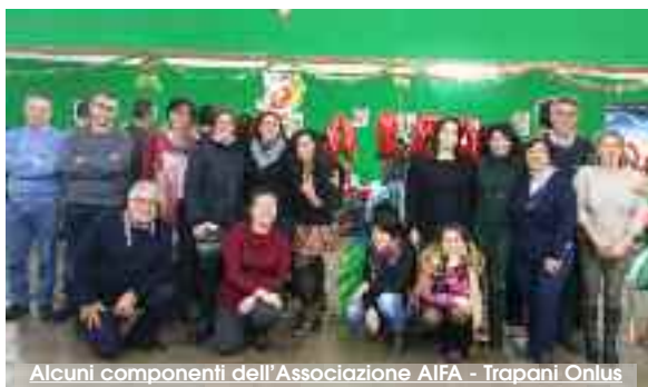
Alcuni componenti dell'Associazione AIFA - Trapani Onlus

zialmente potrebbero essere afflitti circa 2.180 soggetti». Ecco una delle ragioni per cui è necessario avere a Trapani un centro di riferimento per l'Adhd presso il quale avere una diagnosi certa e intraprendere una terapia specifica. In atto l'ASP di Trapani non può offrire la terapia "cognitivo-comportamentale" perché non è prevista in pianta organica una figura professionale di questo tipo. I genitori di bambini affetti da Adha sono costretti a farsi carico di spese presso professionisti privati o a rivolgersi presso centri lontani da Trapani e dalla Sicilia. Le liste di attesa vanno dai tre a sei mesi, per una visita ambulatoriale o per un ricovero di cinque o dieci giorni. I centri di riferimento che che l'AIFA di Tra-