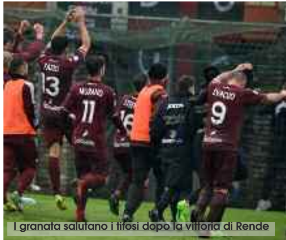
I granata salutano i tifosi dopo la vittoria di Rende